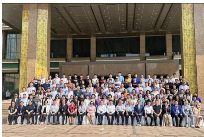
主禮嘉賓與各省/自治區代表合照