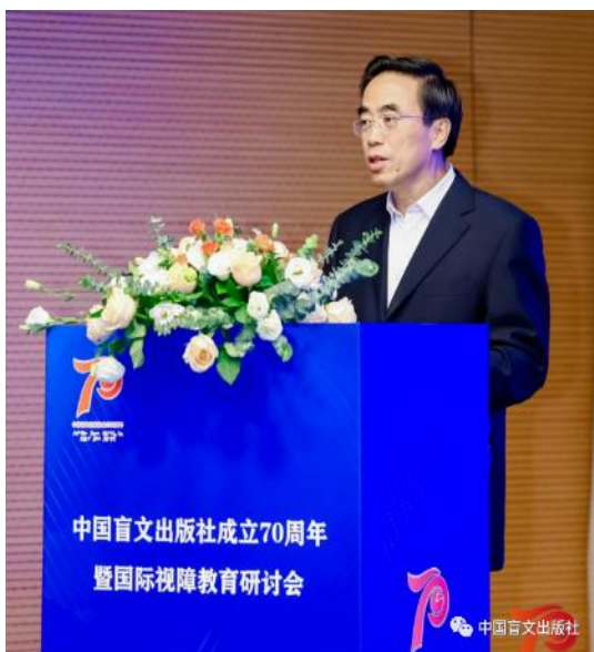
中國殘聯主席在開幕式上致詞