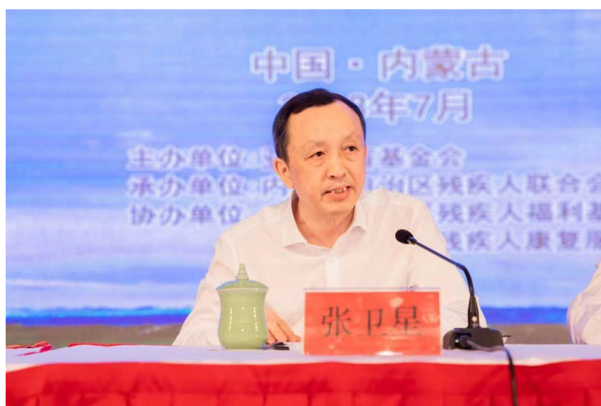
中國殘聯副主席張衛星在交流會開幕式上致詞