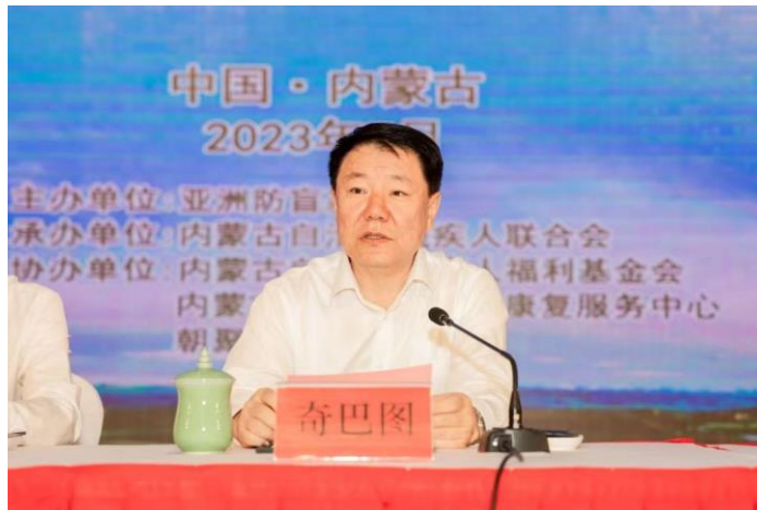
內蒙古自治區副主席奇巴圖在開幕式上講話