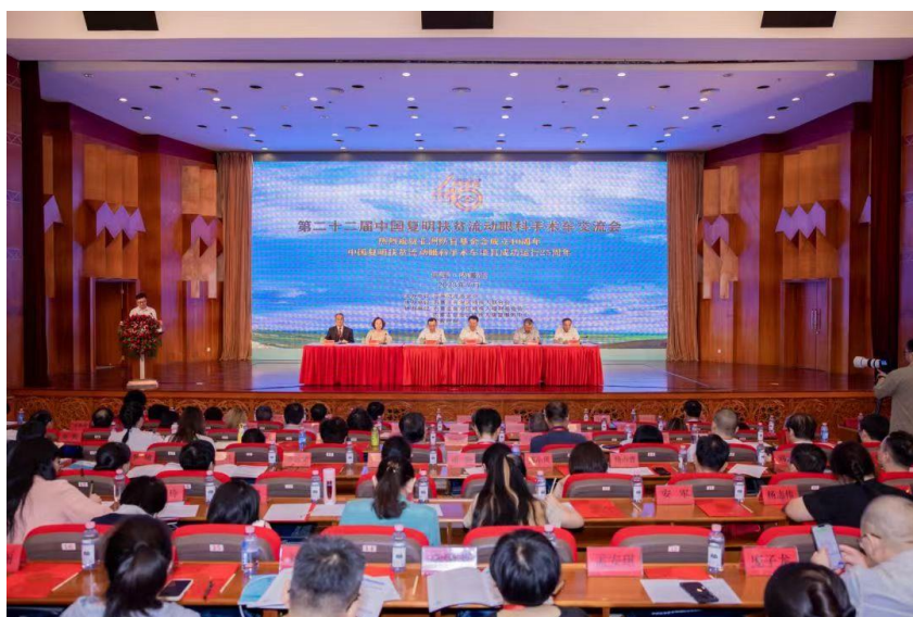
交流會主禮嘉賓及與會者參加交流會開幕式

有鑑於部會講者未能出席論壇，只提供影片及出席論壇的眼科醫生不多，建議本會提前6個月宣佈在新疆伊犁舉行的第23屆中國流動眼科手術車研討會暨學術論壇的舉辦日期，以便更多的內地、香港及國際眼科醫生能預留時間參加，從而促進香港、內地及海外眼科醫生的學術交流。